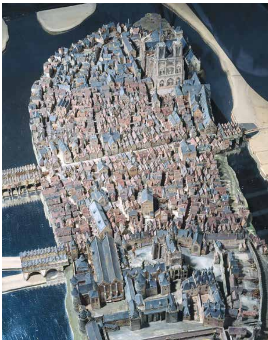
Il. 2. Makieta Île de la Cité z ok. 1527 roku wykonana przez Théodore'a Hoffbauera ok. 1900 roku. Musée Carnavalet, Histoire de Paris, nr inw. P.M 8 ( http://www.carnavalet.paris.fr/fr/collections/l-ile-de-la-cite-vers-1527 )