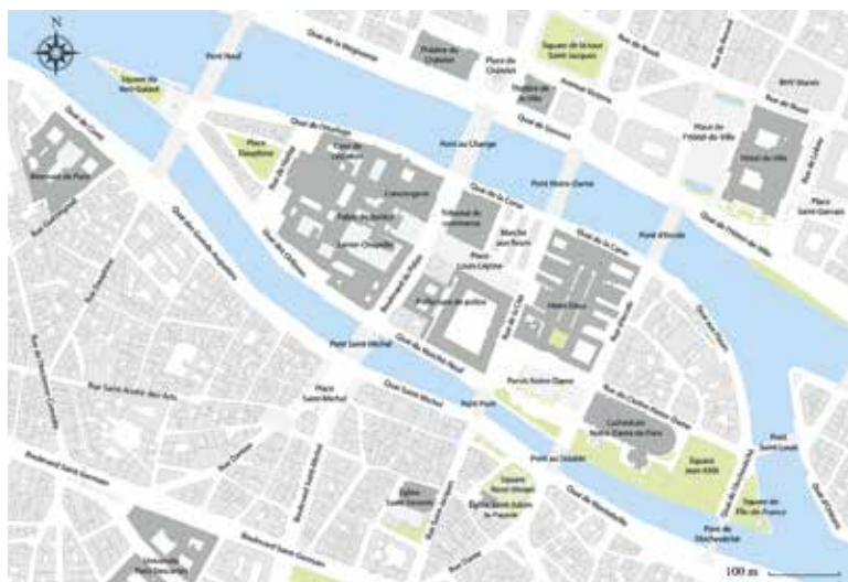
Il. 3. Współczesna mapa Île de la Cité