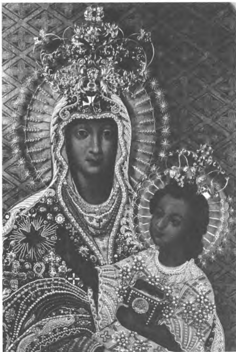
11. Czarna. Fragment łaskami słynącego obrazu Matki Bożej Szkaplerznej przyozdobionego suknią haftowaną z koralami