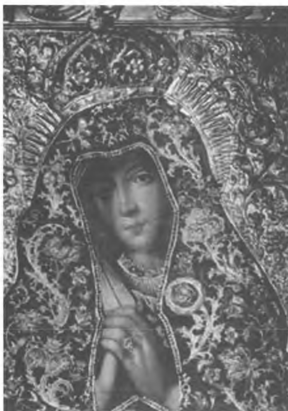
6. Kamedulska Pani. Repr. obrazu Królowej Pustelników w świątyni Eremu w Krakowie na Bielanych (mal. O. Wenanty Kameduła XVII w.)