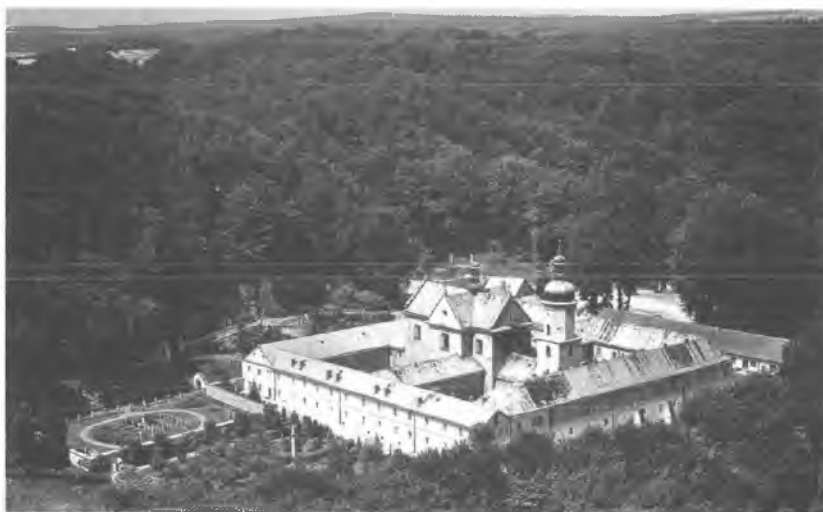
9. Czerna widok klasztoru z lotu ptaka