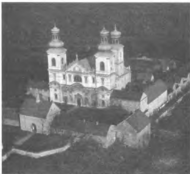
2. Kraków Bielany. Widok od strony południowo-zachodniej