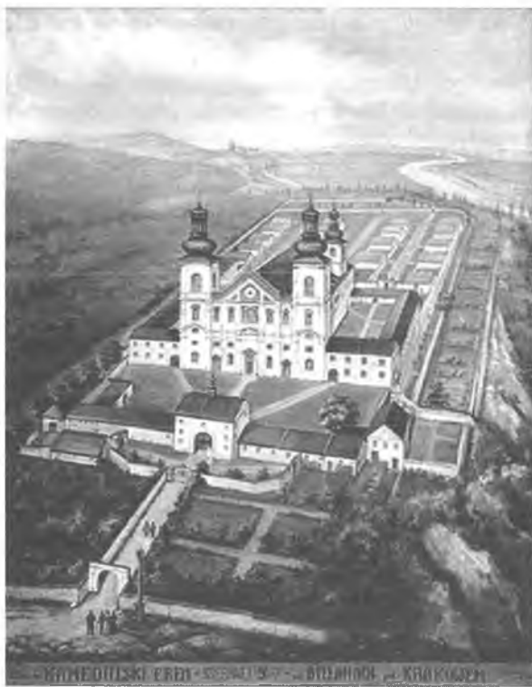
1. Kamedulski Erem Srebrnej Góry na Bielanych w Krakowie. Repr. obrazu olejnego (XVI wiek)