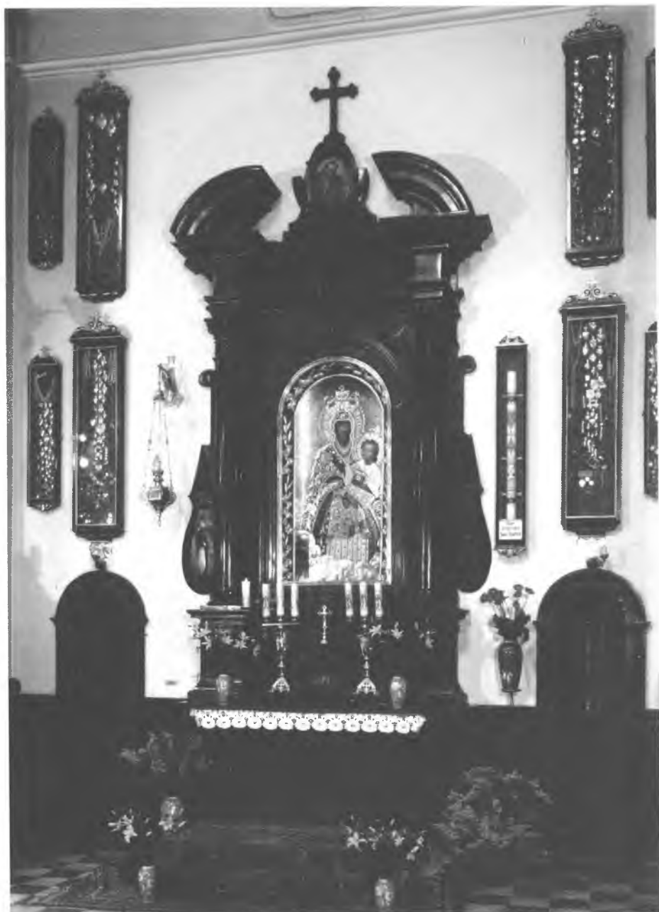
13. Czerna. Marmurowy ołtarz Matki Bożej Szkaplerznej