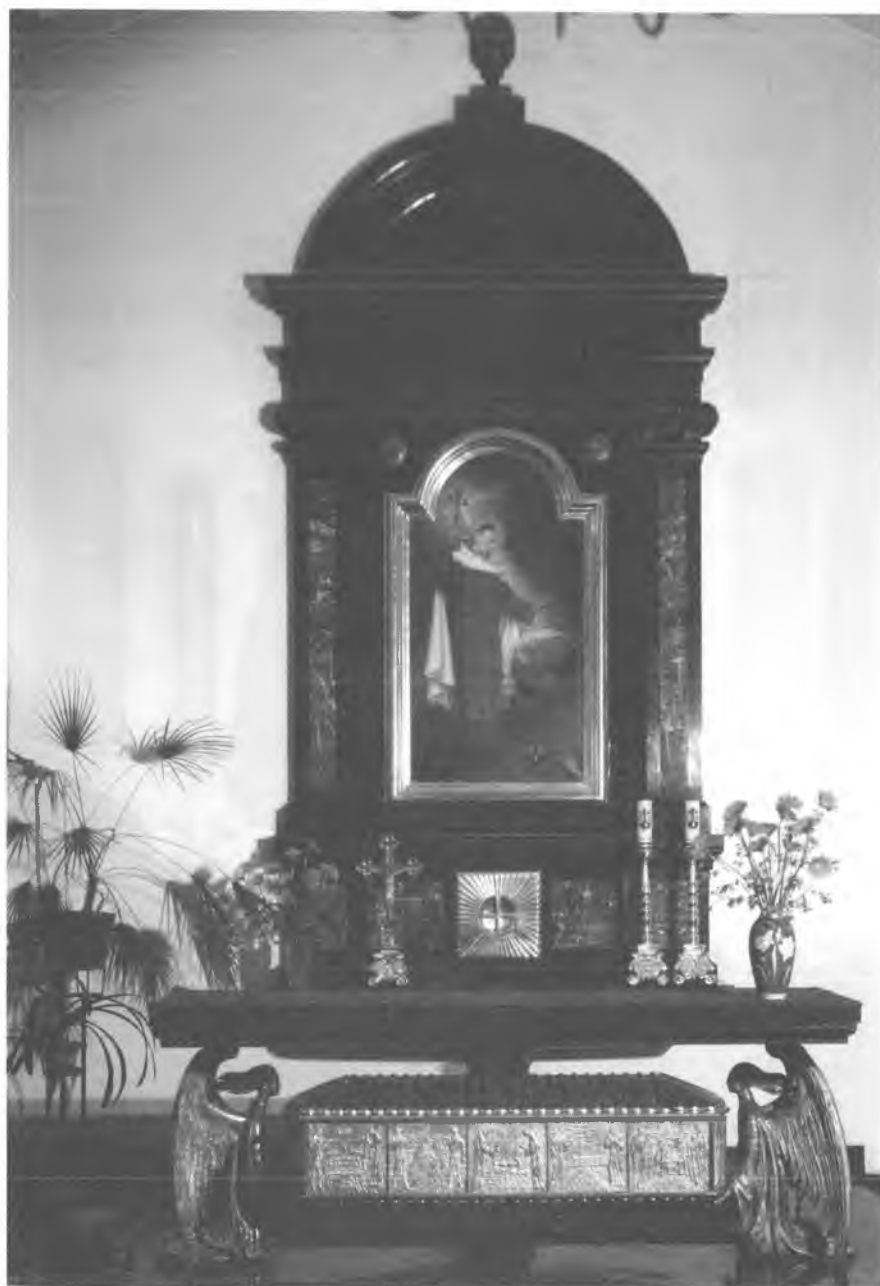
13. Czerna. Ołtarz z sarkofagiem św. Rafała Kalinowskiego