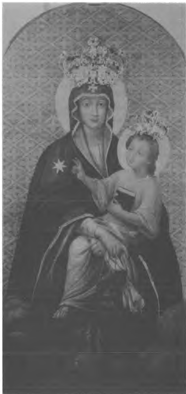
12. Czarna. Łaskami słynący obraz Matki Bożej Szkaplerznej z połowy XVIII w., malowany na blasze miedzianej