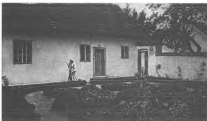
5. Eremitarz z ogródkiem pustelnika. Pocztówka wydana nakładem Ojców Kamedułów na Bielanych w 1 poł. XX w.