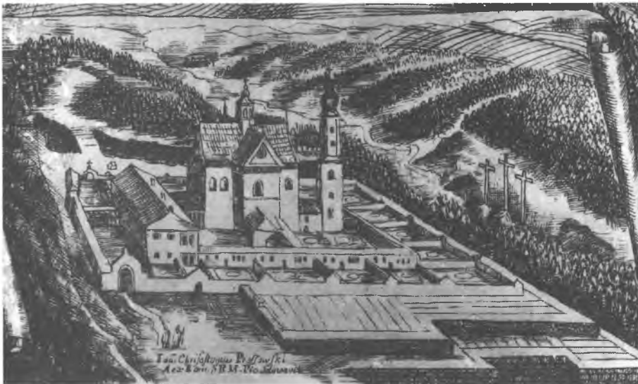
8. Widok na klasztor. Fragment kwasorytu Jerzego Forstera. APKB w Czernej