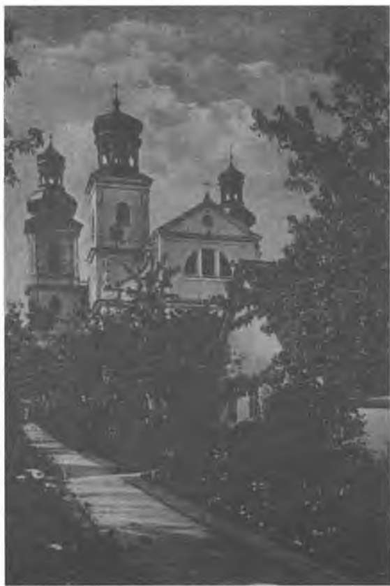
4. Widok na kościół od strony Eremitarzy. Pocztaówka wydana nakładem Ojców Kamedułów na Bielanych w 1 poł. XX w.