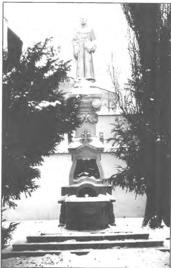
18. „Pomnik” bł. Szymona z Lipnicy.