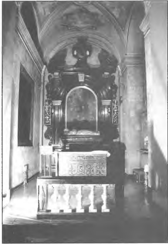
7. Kościół Bernardynów, wnętrze.