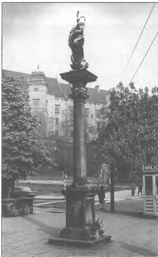
17. Kolumna z figurą N. P. Maryi Niepokalanie Poczętej, po 1734 roku.