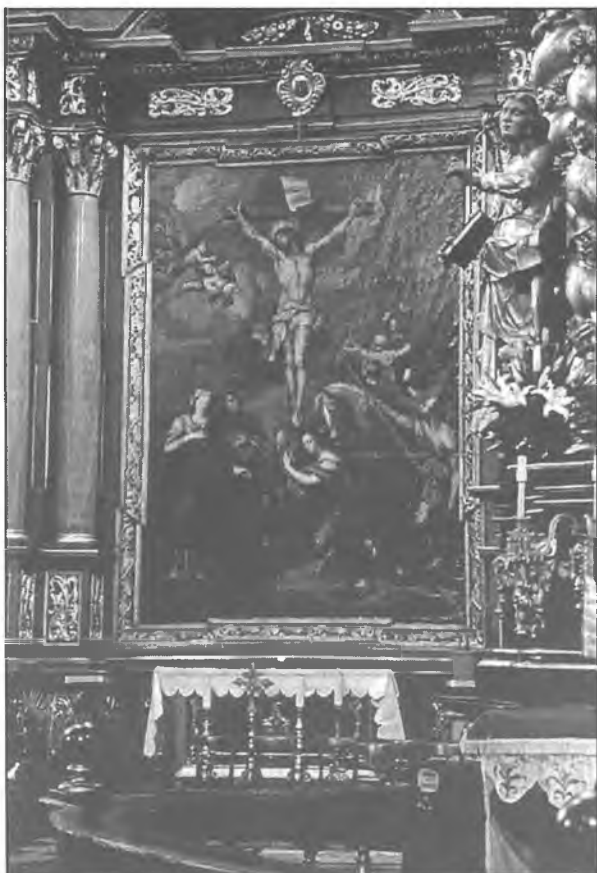
11. Część środkowa ołtarza z obrazem Ukrzyżowanie w kościele Bernardynów, ok. 1659-1664.