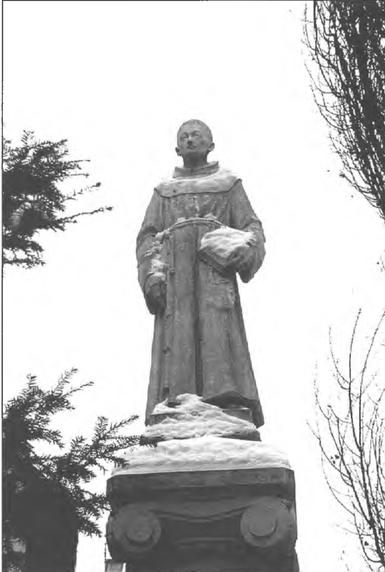
19. Posąg z „pomnika” bł. Szymona z Lipnicy.