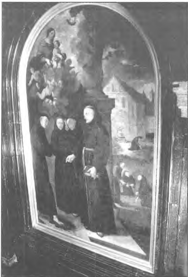
13. Obraz z końca XVII wieku.