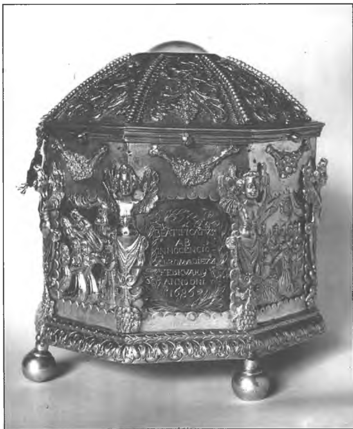
15. Relikwiarz na głowę bł. Szymona z Lipnicy w klasztorze Bernardynów, sprzed 1686 roku.