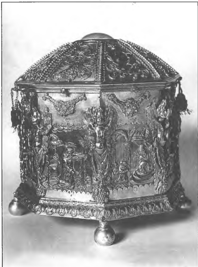
16. Relikwiarz na głowę bł. Szymona z Lipnicy w klasztorze Bernardynów, z przed 1686 roku.