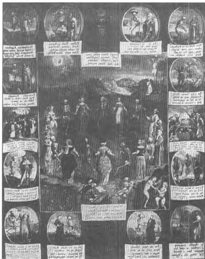
14. Obraz „Taniec śmierci” w kościele Bernardynów.