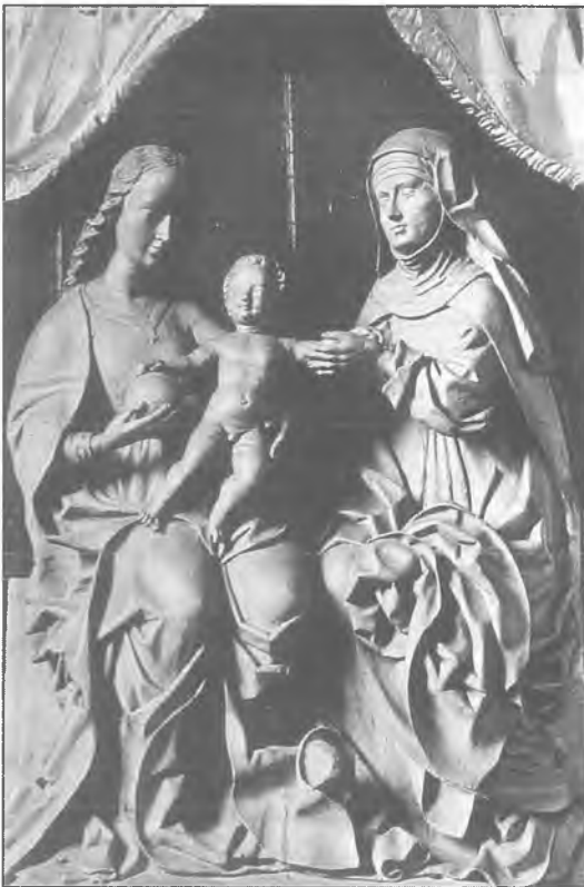
10. Posąg Św. Anny Samotrzeć w kościele Bernardynów, koniec XV wieku.