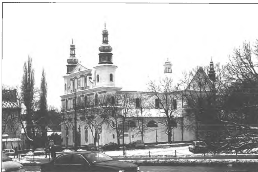
1. Kościół Bernardynów, widok od fasady.