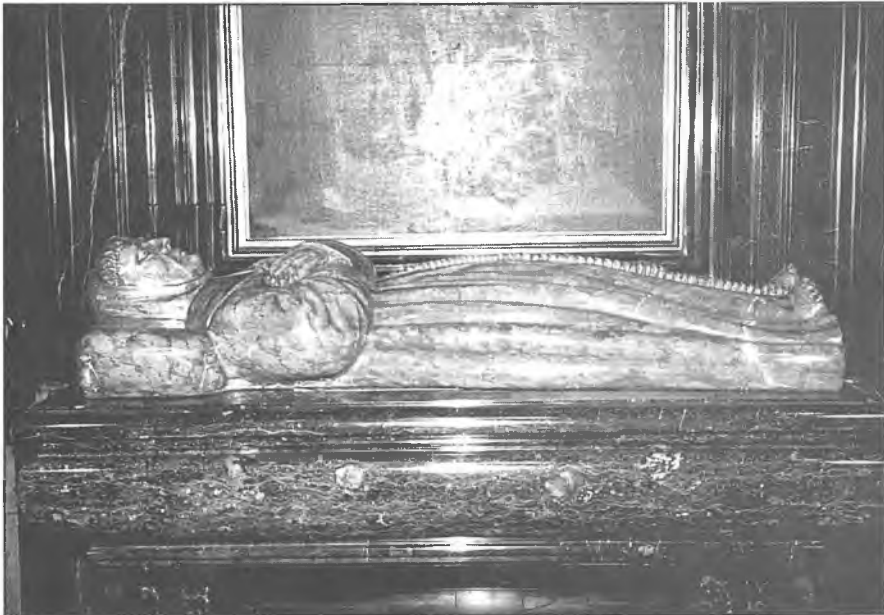
8. Nagrobek br. Szymona z Lipnicy w kaplicy br. Szymona.