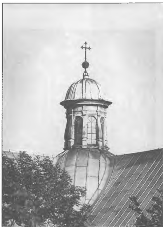
4. Latarnia kopuły kościoła Bernardynów.