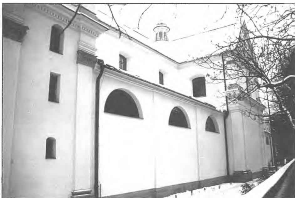
3. Kościół Bernardynów, widok od pn.-wsch.