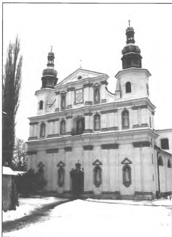
2. Kościół Bernardynów, widok od pn.-wsch.