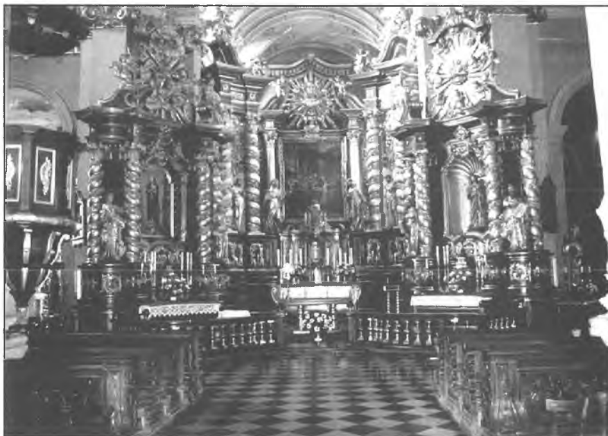
6. Kościół Bernardynów, wewnątrz.