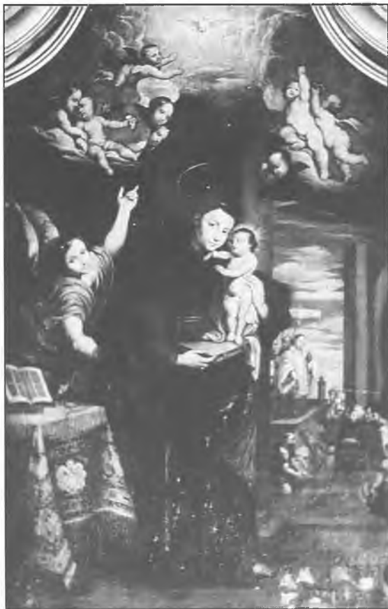
12. Obraz w ołtarzu bocznym z wizerunkiem św. Antoniego.