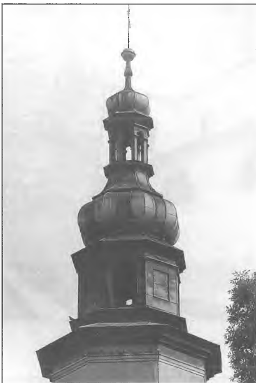
5. Górna część wieży kościoła Bernardynów.