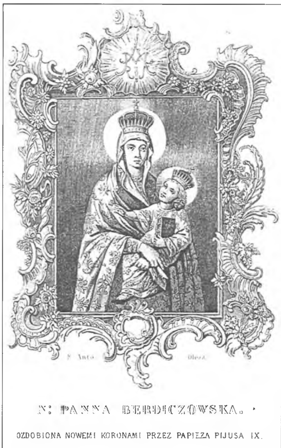
6. Obraz Matki Bożej Szkaplerznej. Staloryt Antoniego Oleszczyńskiego z XIX w.