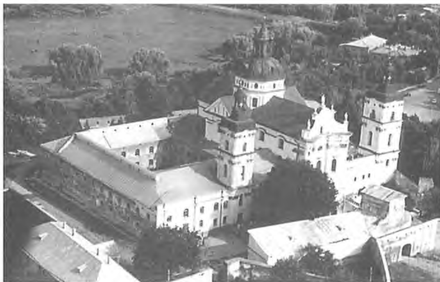
9. Klasztor Karmelitów Bosych w Berdyczowie.