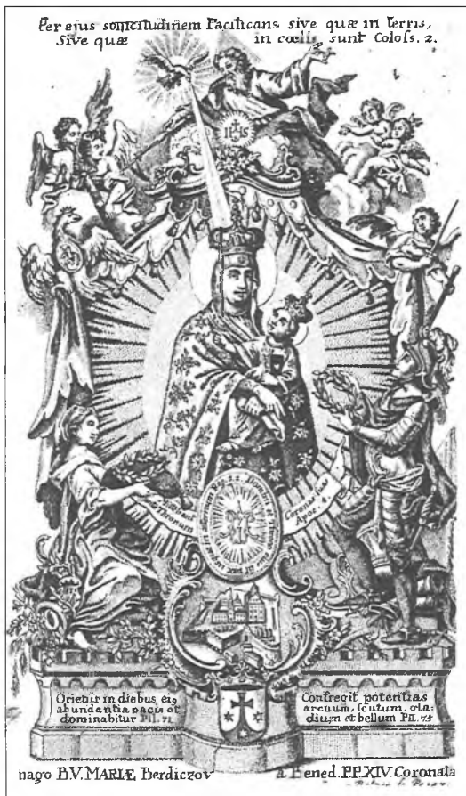
3. Obraz Matki Bożej Berdyczowskiej. Miedzioryt Jana Balcera z Pragi (2 poł. XVIII w.).