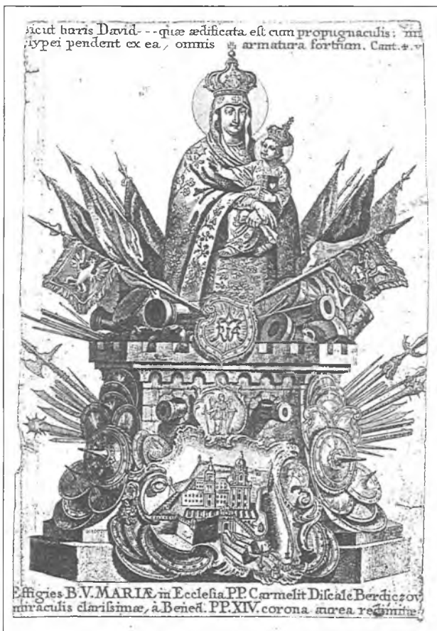
5. Obraz Matki Bożej otoczony armaturą z widokiem klasztoru. Miedzioryt: Göz senior (Gottfried Berhard) et junior (Franz Regis z 2 poł. XVIII w.).