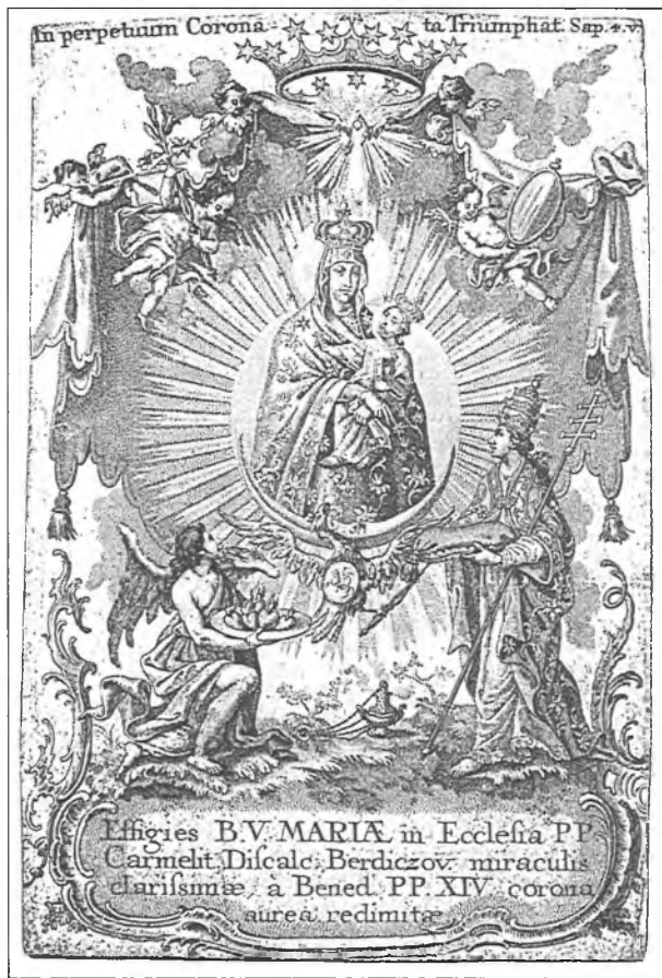
4. Obraz Matki Bożej Berdyczowskiej. Miedzioryt Ignacego Verhelsta (2 poł. XVIII w.).