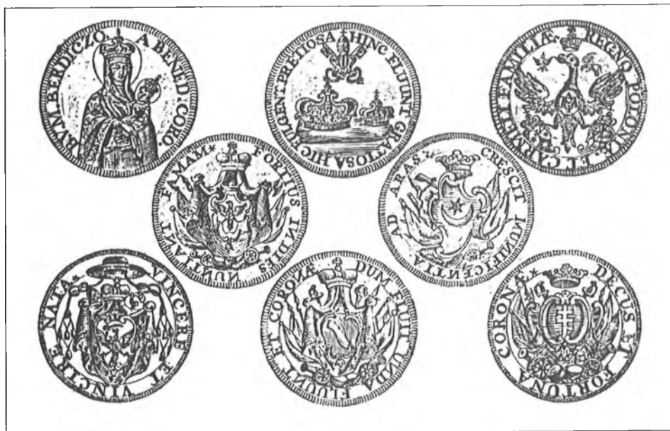
7. Medale wybite na koronację obrazu. Miedzioryty Teodora Rakowieckiego z XVIII w.