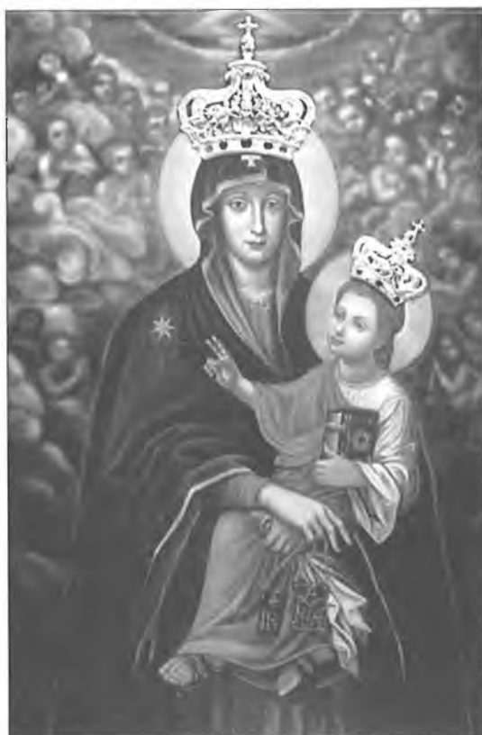
8. Nowy obraz Matki Bożej ukoronowany w 1998 r.