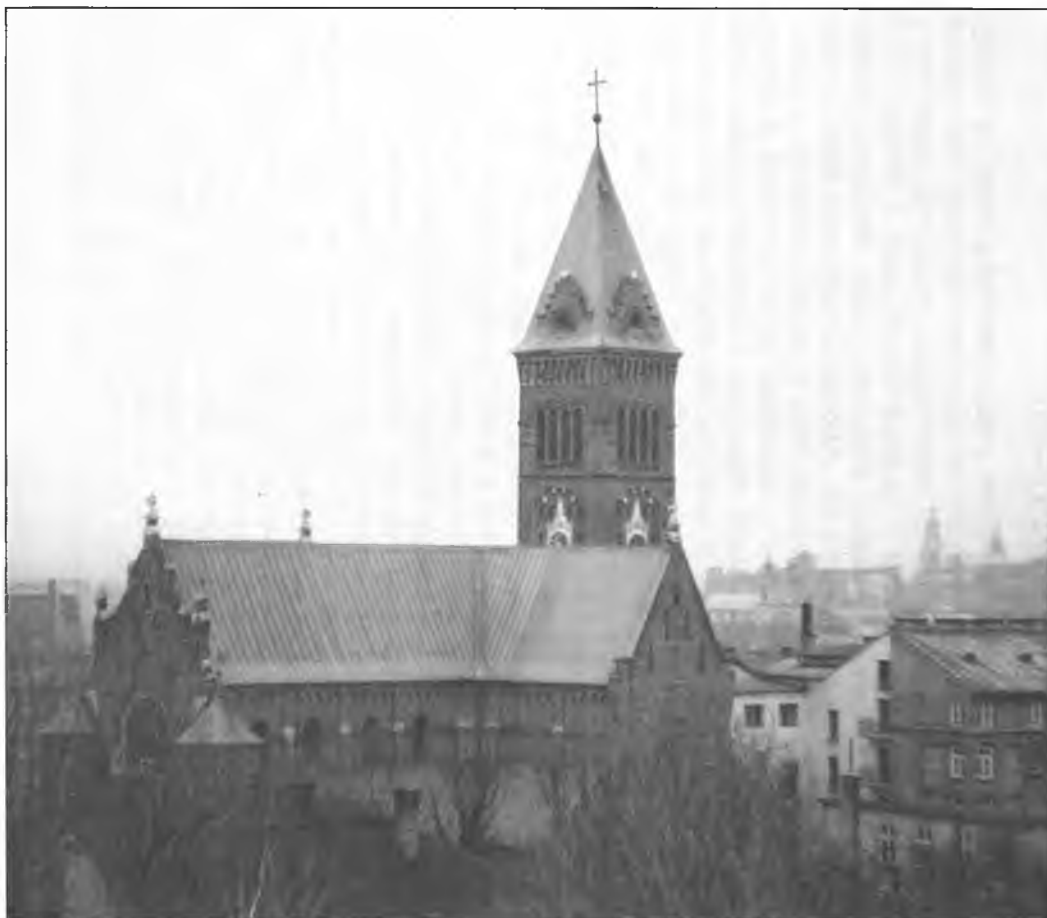
1. Kościół Redemptorystów w Krakowie-Podgórzu.