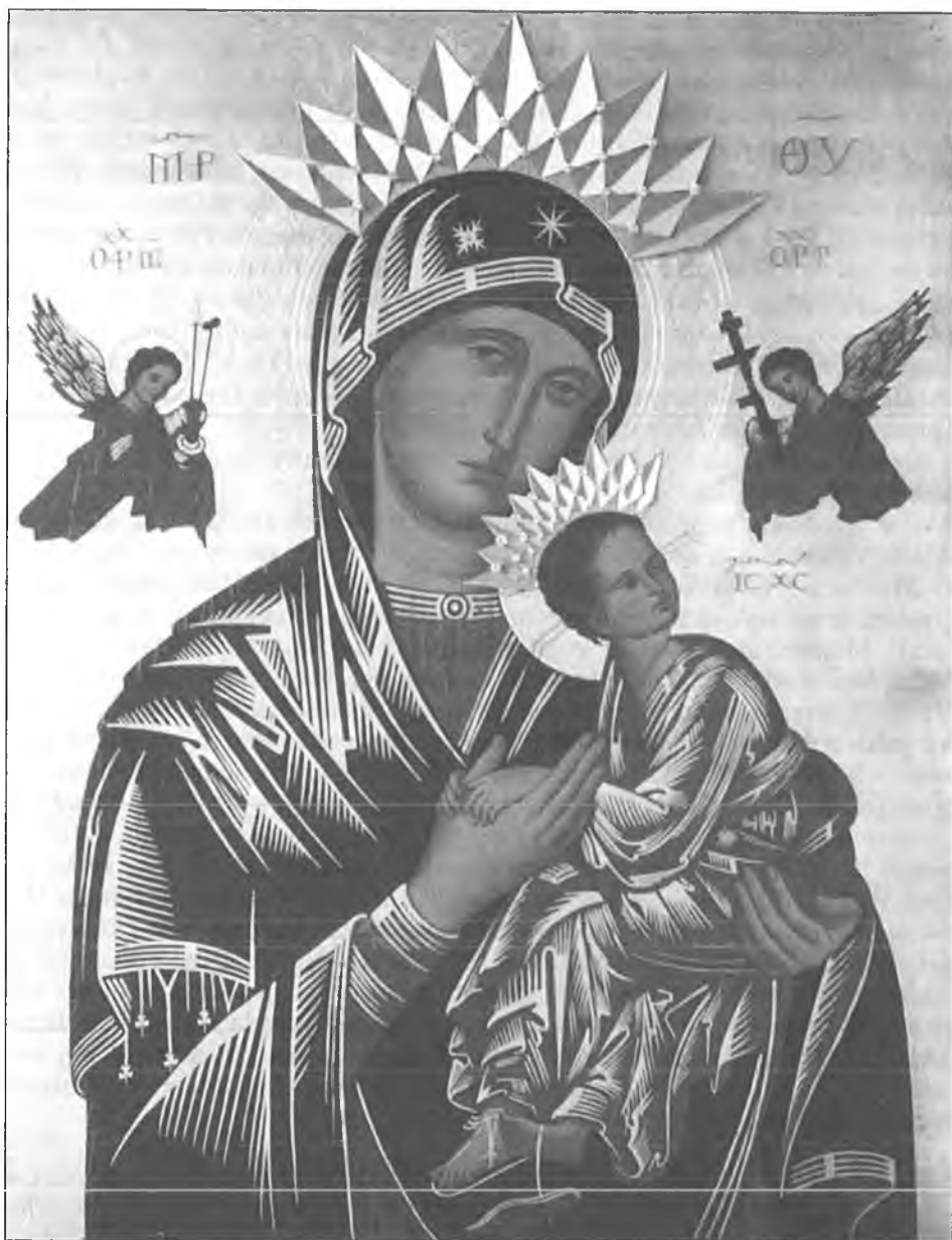
4. Ikona Matki Bożej Nieustającej Pomocy w kościele Redemptorystów w Krakowie, po koronacji w 1994 r.