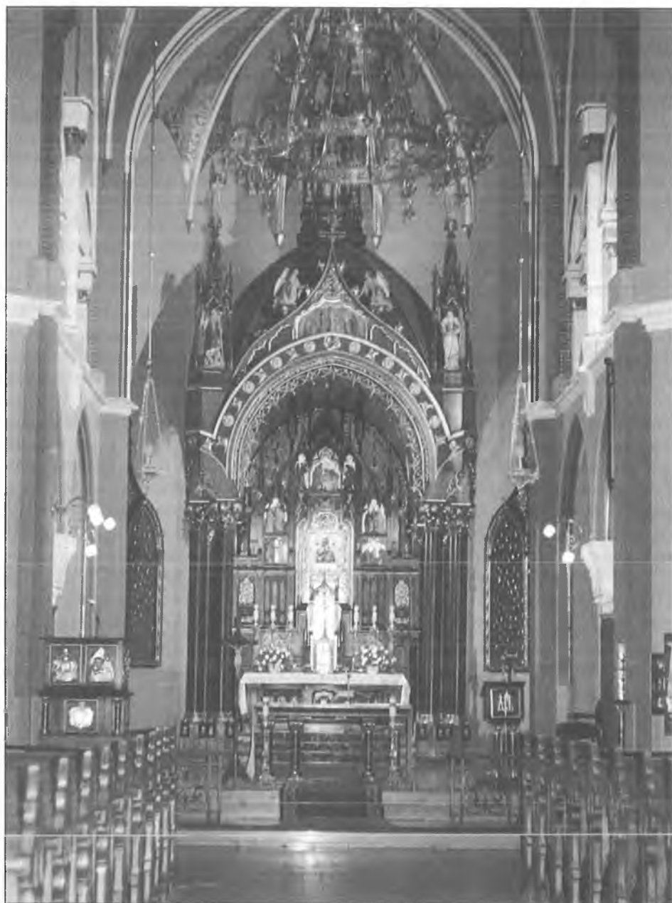
2. Wielki ołtarz z ikoną Matki Bożej Nieustającej Pomocy w kościele Redemptorystów w Krakowie-Podgórzu.