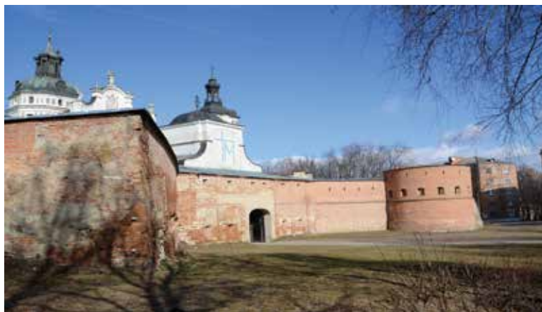
8. Front południowo-wschodni obwarowań, dwuramiennik kleszczowy, kurtyna z bramą wjazdową i basteja, 6.03.2015.