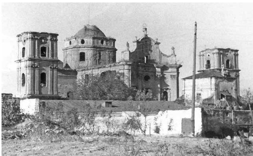
4. Zniszczony podczas II wojny światowej zespół klasztorny. Widok od strony południowo-wschodniej. Fotografia z 1966 roku. Wg B. Wanat, Klasztor Karmelitów Bosych na Ukrainie , Kraków 2007, il. 9