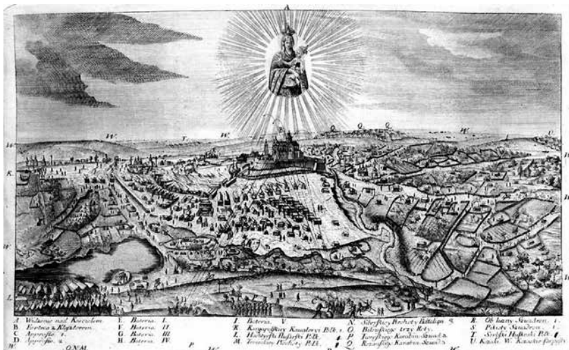
3. Oblężenie Fortecy Najświętszej Marii Panny przez Rosjan w maju 1768 roku. Grafika Teodora Rakowieckiego. Wg B. Wanat, Klasztor Karmelitów Bosych na Ukrainie , Kraków 2007, il. 28