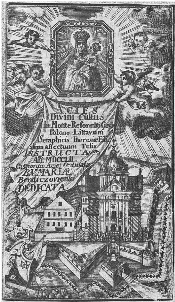
9. Forteca po przebudowie w latach 1739–1754. Widok od strony południowo-wschodniej. Miedzioryt z drugiej połowy XVIII wieku. Wg B. Wanat, Klasztor Karmelitów Bosych na Ukrainie , Kraków 2007, il. 49