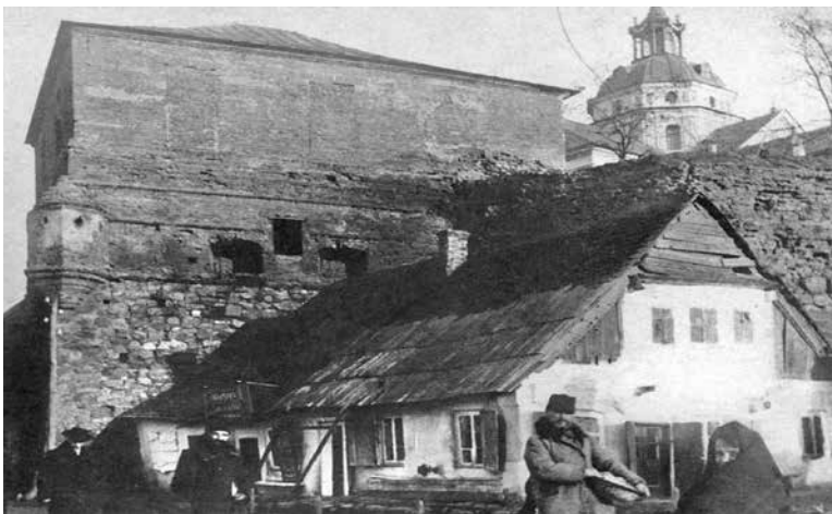
6. Półbastion zachodni, front północno-zachodni obwarowań. Widoczne dwie strzelnice artyleryjskie oraz narożna kawaliera. Fotografia z początku xx wieku. Wg B. Wanat, Klasztor Karmelitów Bosych na Ukrainie , Kraków 2007, il. 7