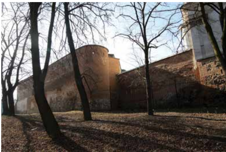
7. Półbastion w systemie nowowłoskim, front północno-wschodni obwarowań, widok od północy, 6.03.2015.