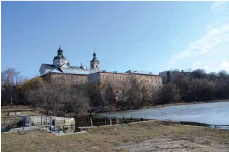
5. Widok fortecy z grobli na Gniłpiacie. Front południowo-zachodni obwarowań, 6.03.2015.