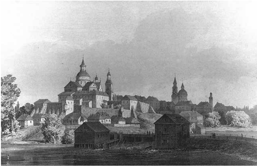
1. Forteca berdyczowska, widok od zachodu. Na pierwszym planie rzeka Gniłopiat z groblą i młynami. Rysunek z natury Napoleona Ordy, litografia Maksymiliana Fajansa. Wg B. Wanat, Klasztor Karmelitów Bosych na Ukrainie , Kraków 2007, il. 1