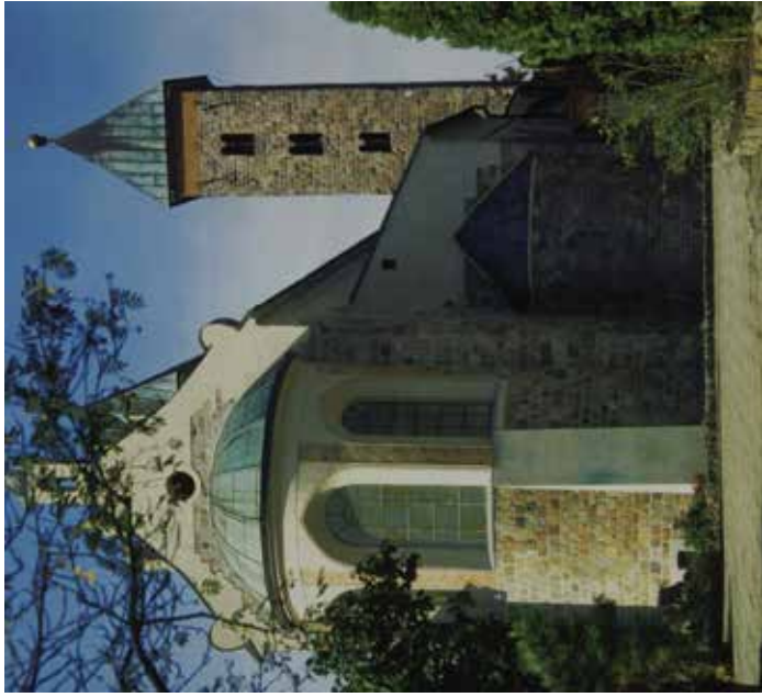
1. Czerwiński, kościół Kanoników Regularnych w Czerwińsku, widok od prezbiterium, przed połową XII wieku.