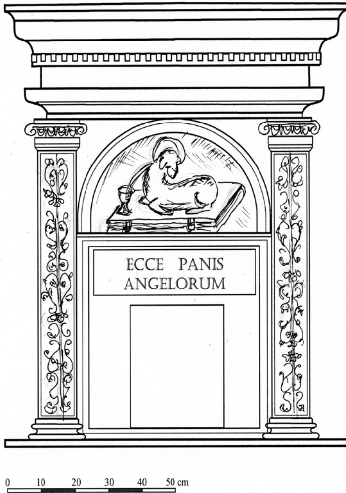
7. Rekonstrukcja rysunkowa wyglądu sakrarium z kościoła Kanoników Regularnych w Czerwińsku, początek lat 30. XVI wieku. Rys. E. Korpysz