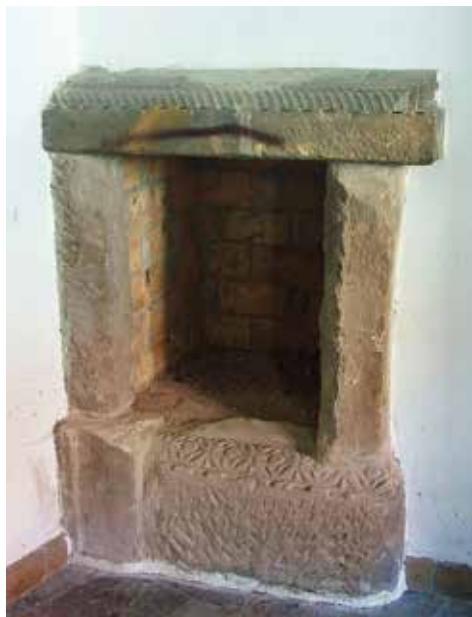
4. Kominek w klasztorze w Czerwińsku, po 1524 roku.