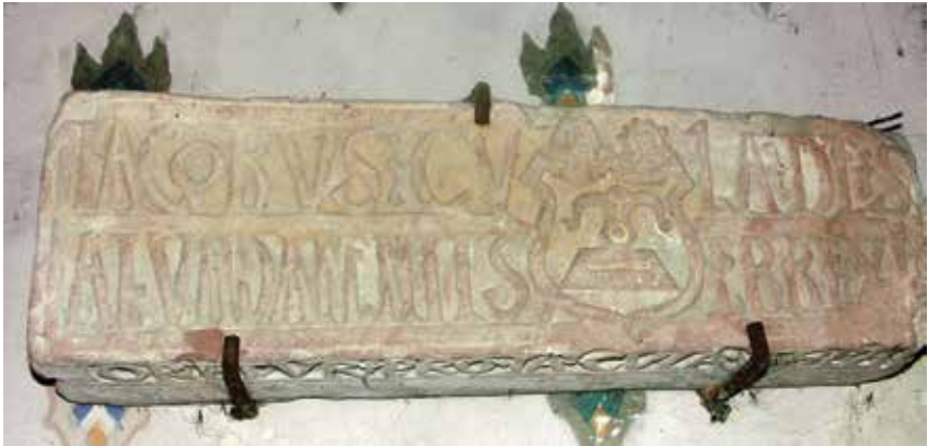
3. Relikt nadproża w lapidarium w kruchcie kościoła klasztornego w Czerwińsku, po 1524 roku.