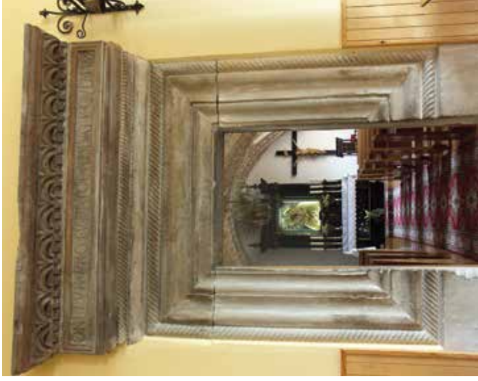
2. Portal do refektarza w klasztorze w Czerwińsku, 1529.