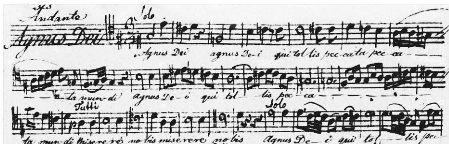
Przykł. 2 Partia tenora solo w Agnus Dei .