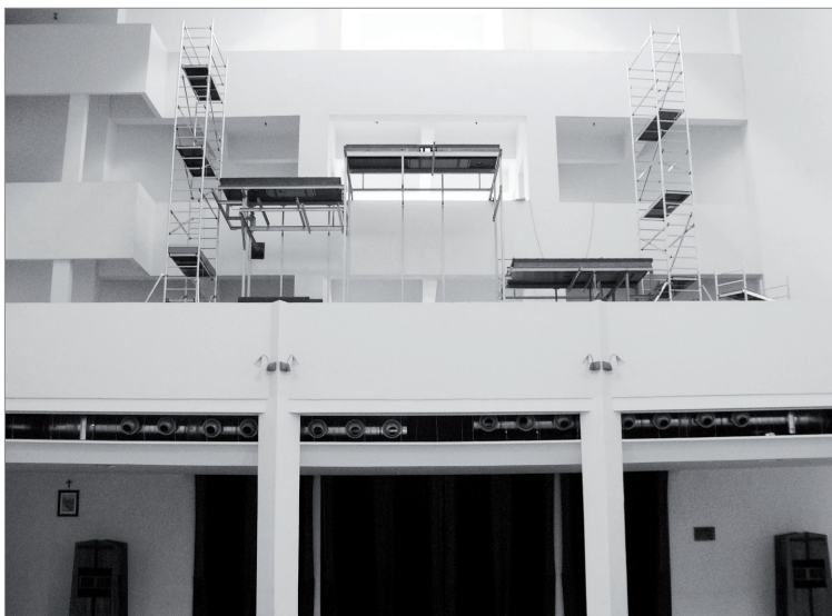
2. Konstrukcja nośna