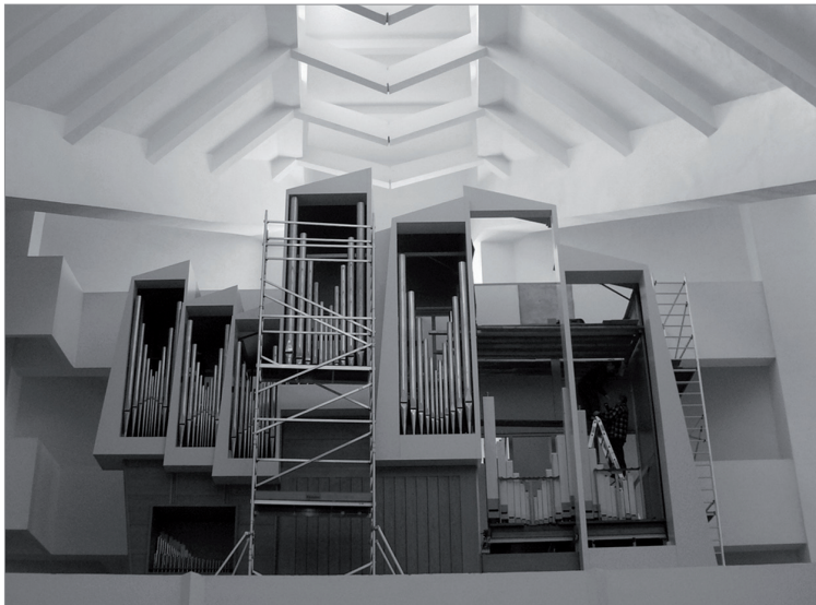
5. Ostatni etap prac przy sekcji pedał