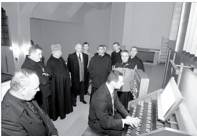
6. Prezentacja instrumentu w końcowym odcinku budowy