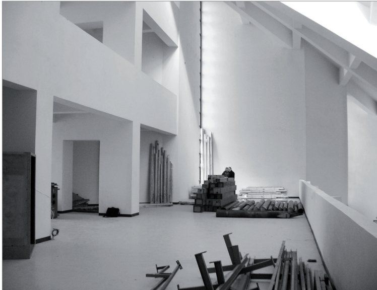
1. Początek prac w kościele św. Stanisława BM