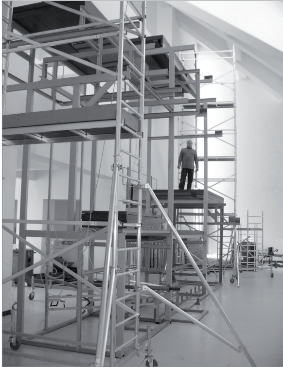
3. Montaż wiatrownic