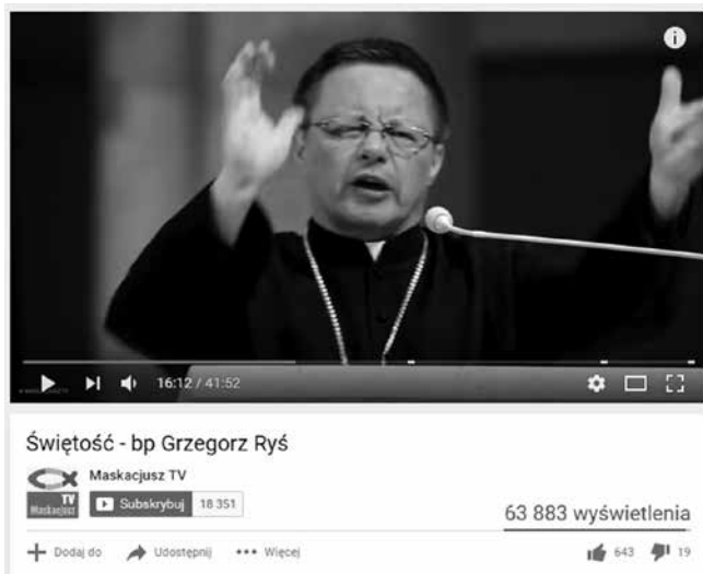
Fot. 5. Bp Grzegorz Rys – Vlog „Świętość”.

z YT są również vlogi biskupa zamieszczone na Stacja7.pl, wortalu wiary zbudowanym według projektu Szymona Hołowni. Aktywność biskupa w blogosferze można scharakteryzować jako ex cathedra , gdyż duchowny wyjaśnia świat z punktu widzenia doktryny katolickiej i wprowadza nas w tajemnice wiary oficjalnie.