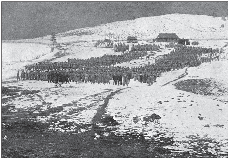
Załącznik nr 13. Msza święta polowa odprawiana dla Legionów Polskich.