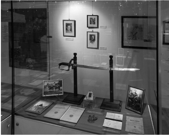
9. Wystawa czasowa „Wieliczka na drodze ku niepodległości”, 09.11.2016–28.02.2017.