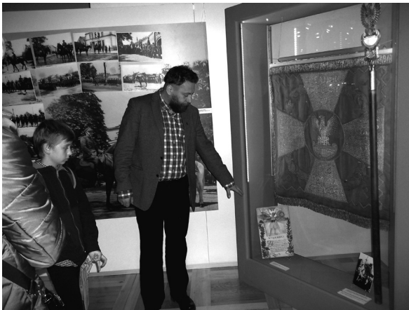
10. Wystawa czasowa „Wieliczka na drodze ku niepodległości”, 09.11.2016–28.02.2017.