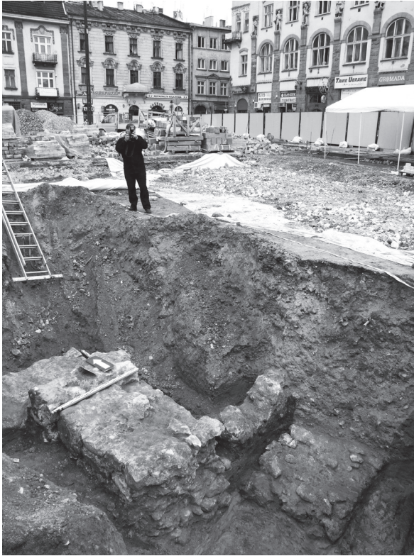
Ryc. 2. Zachowane relikty fundamentów ściany północnej i przypory wczesnogotyckiego kościoła św. Szczepana w Krakowie na tle zabudowy przy Placu Szczepańskim odsłonięte w wyniku wykopalisk archeologicznych prowadzonych w 2009 r. pod kierunkiem E. Dubis.

z dominikańskiego kościoła św. Jakuba w Sandomierzu oraz kościoła św. Stanisława w Chlewisku koło gniazda rodowego w Odrowążu (tutaj wezwanie kościoła musi wskazywać na fundację dokonaną po 1253 r.).