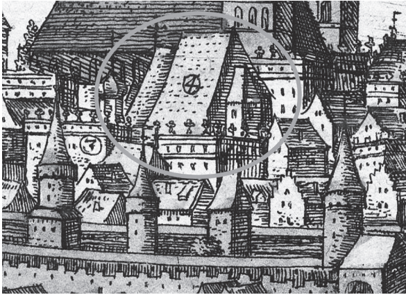
Ryc. 4. Bryła gotyckiego kościoła św. Szczepana w Krakowie wraz z zadaszaniem i późniejszym przedsięwzięciem na wędruce Krakowa z lat 1603–1605 wydrukowanej w dziele Geорга Brauna i Fransa Hogenberga Civitates orbis terrarum .