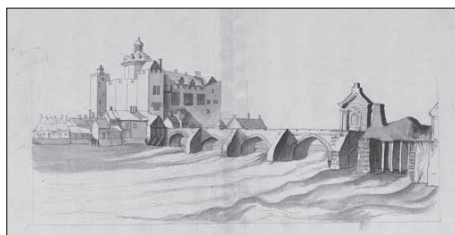
Ryc. 3. Most i zamek w Athlone w 1685 roku (most ma tu tylko pięć łuków)