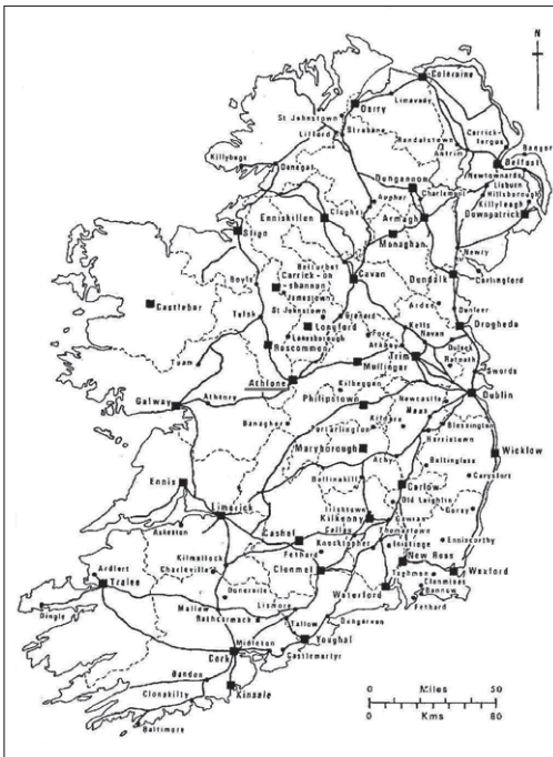
Ryc. 1. Miasta i główne drogi Irlandii, mapa autorstwa J.H. Andrewsa