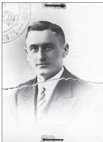
Ryc. 4. Zdjęcie Witolda Pileckiego w Protokole egzaminu z VI klasy gimnazjum dla eksternistów