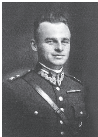
Ryc. 2. Zdjęcie Witolda Pileckiego w indeksie Szkoły Nauk Politycznych w Wilnie